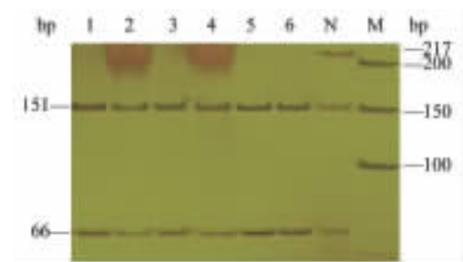
图 2 PCR-RFLP 分析卵巢癌组织 EGFR 基因第 21 外显子的突变情况

将卵巢癌组织 EGFR 基因第 21 外显子扩增产物经 Msc I 酶切后,2% 琼脂糖电泳检测,L858R 点突变的阳性对照 NSCLC 有 3 条条带,长度约 217 bp、151 bp 和 66 bp(图 2),卵巢癌组织则为 2 条条带,长度为 151 bp 和 66 bp,提示所检测卵巢癌中 EGFR 基因第 21 外显子没有 L858R 位点突变。