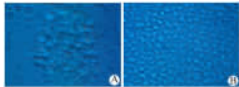
图 1 倒置显微镜下第 4 天 (A) 和第 10 天 (B) PHA-CD3AK 细胞的形态 (×800)

培养至第 4 天, 细胞呈集落样聚集生长, 同时可见呈圆形、条梭状等不规则形状的散在细胞, 细胞表面有数量不一的突起, 胞体增大。培养到第 10 天, 细胞呈均匀密集生长, 体积明显增大, 约为正常淋巴细胞的 2 倍, 80%~90% 为圆形, 少量呈梭状和不规则形细胞 (图 1)。